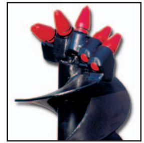
Denti tipo BM per terreno roccioso Rock teeth model BM